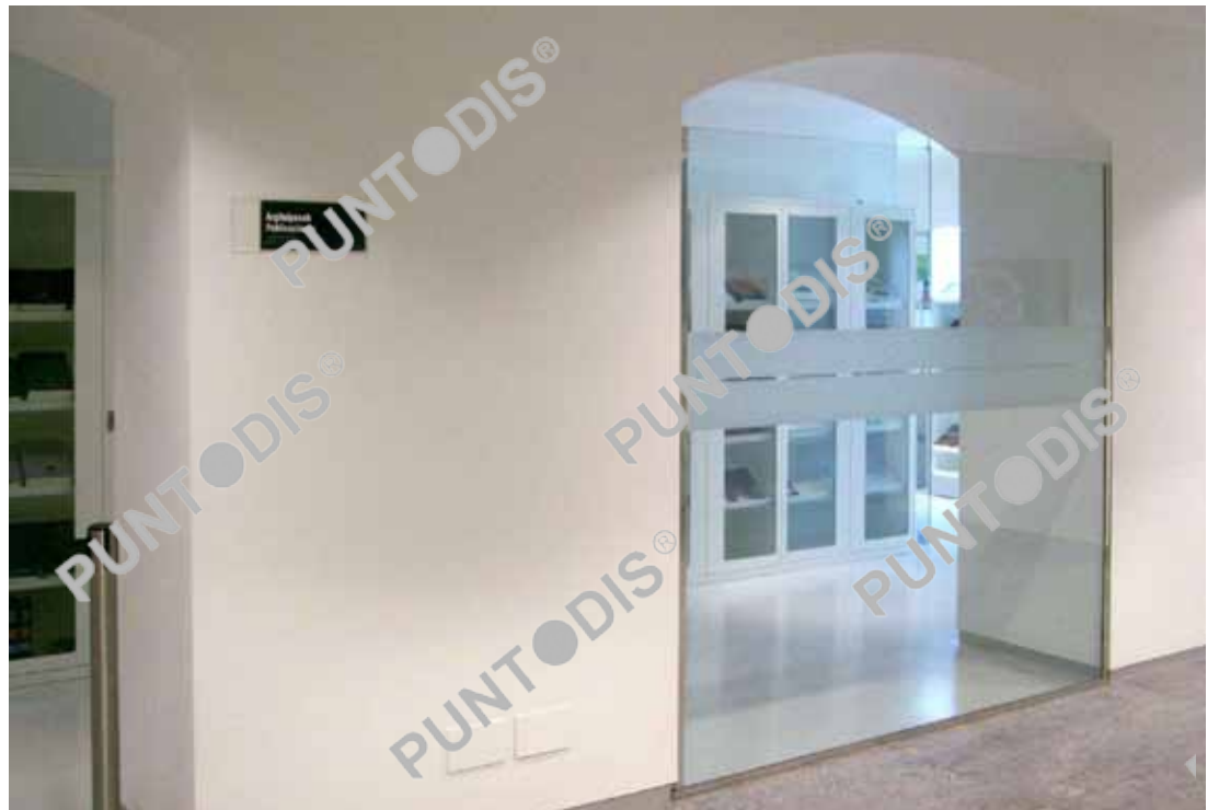
Señalización de puertas