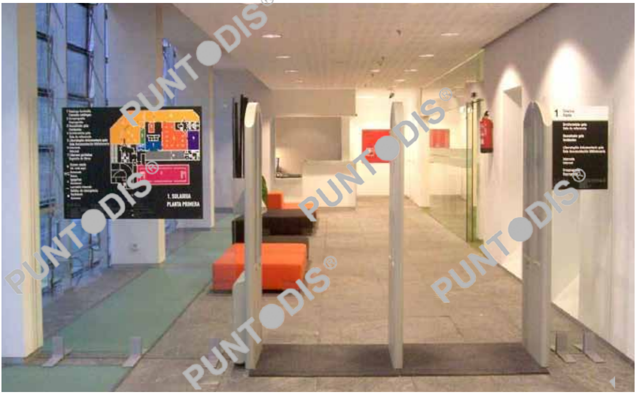
Plano de situación y directorio planta