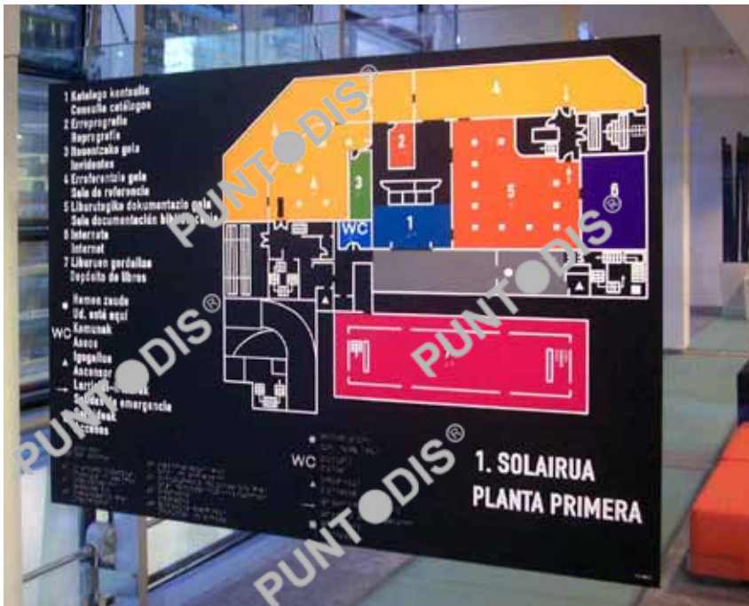
Plano de situación y detalle